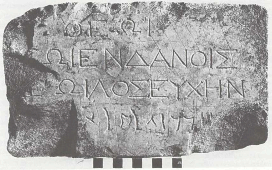
DAN. Figure 2. Bilingual inscription . Found in the cultic precinct; Greek above, Aramaic below. The text reads “To the God who is in Dan, Zoilos made a vow” and comprises forceful evidence for the identification of Tell el-Qadi with biblical Dan. Dated c. 200-150 BCE.

DAN. Figura 2, Inscripción Bilingüe. Hallado en el precinto de culto; Arriba en Griego, abajo en Arameo. El texto dice “Para el Dios que está en Dan, Zoilos haz una venia” y comprende fuerte evidencia para la identificación de Tell el-Qadi con el Dan bíblico. Datado aproximadamente entre los años 200 a 150 ACE.