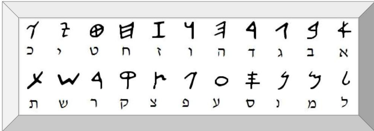
Rows one and three are examples of Old Hebrew letters. Rows two and four are the corresponding letters written in the block Aramaic script.

Primero, el Arameo fue el “idioma internacional” de la corte y comercio en el tiempo de Daniel. Tanto en la corte de Babilonia como en la corte de Persia, el Arameo fue la lengua empleada a través de las fronteras y lindes para la diplomacia así como para el comercio internacional. El Arameo se clasifica como una “lengua Semita,” de la misma familia de lenguas/idiomas que el Hebreo. Tiene el mismo alfabeto básico, aunque el pronunciamiento difiere en varios lugares, sigue mucho de la estructura gramatical principal, y tiene un vocabulario relacionado. 2 Cuando los Judíos fueron exiliados a Babilonia, ellos fueron echados a una cultura que empleó extensivamente el Arameo, y fue probablemente durante este tiempo que muchos de los Judíos empezaron a escribir hasta su Hebreo con la escritura Aramea. Estas fueron las letras en bloque que fueron más familiarmente empleadas en el Hebreo de hoy en día como opuesto a las formas antiguas de las letras del Hebreo halladas en ciertos artefactos. 3